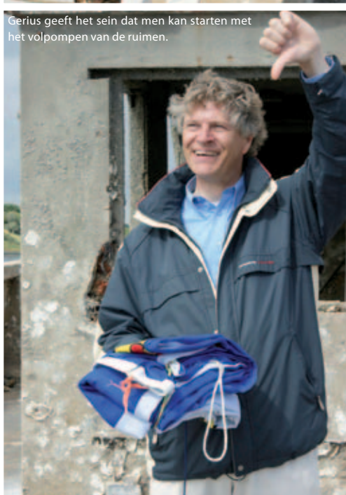
Gerius geeft het sein dat men kan starten met het volpompen van de ruimen.