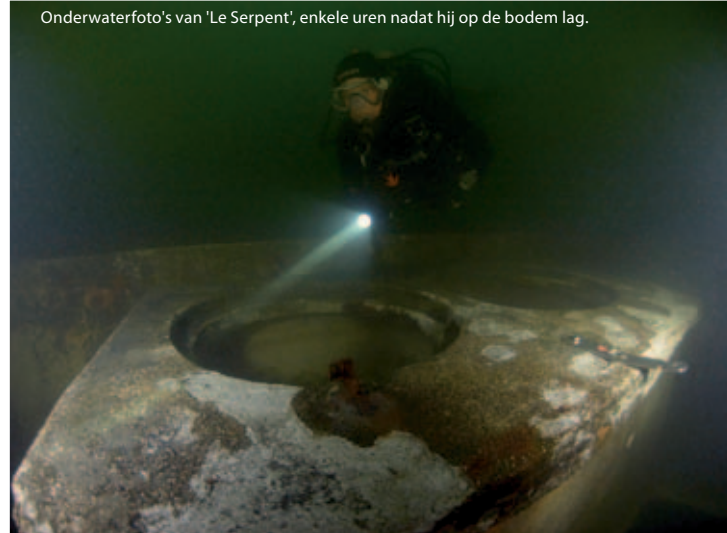
Onderwaterfoto's van 'Le Serpent', enkele uren nadat hij op de bodem lag.